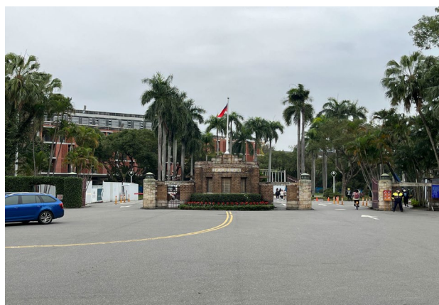
1. 從羅斯福路校門進入