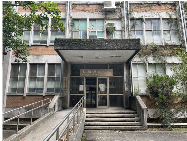
8.進入數學研究中心後左轉