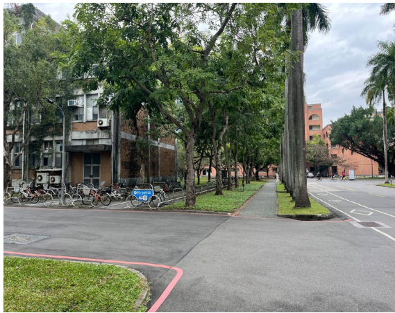
7.經過新生教學館後的下一個路口左邊