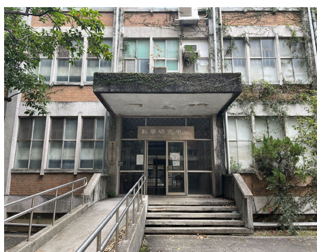
8. 進入數學研究中心後左轉