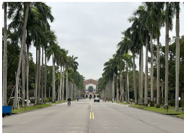
2. 沿椰林大道往總圖方向