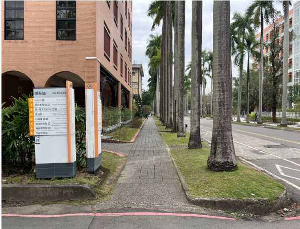
6. 小椰林道上繼續直行