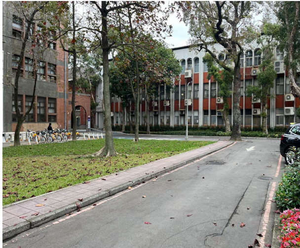
1. 出學輔中心舊辦公室右轉