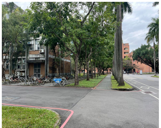
7. 經過新生教學館後的下一個路口左邊