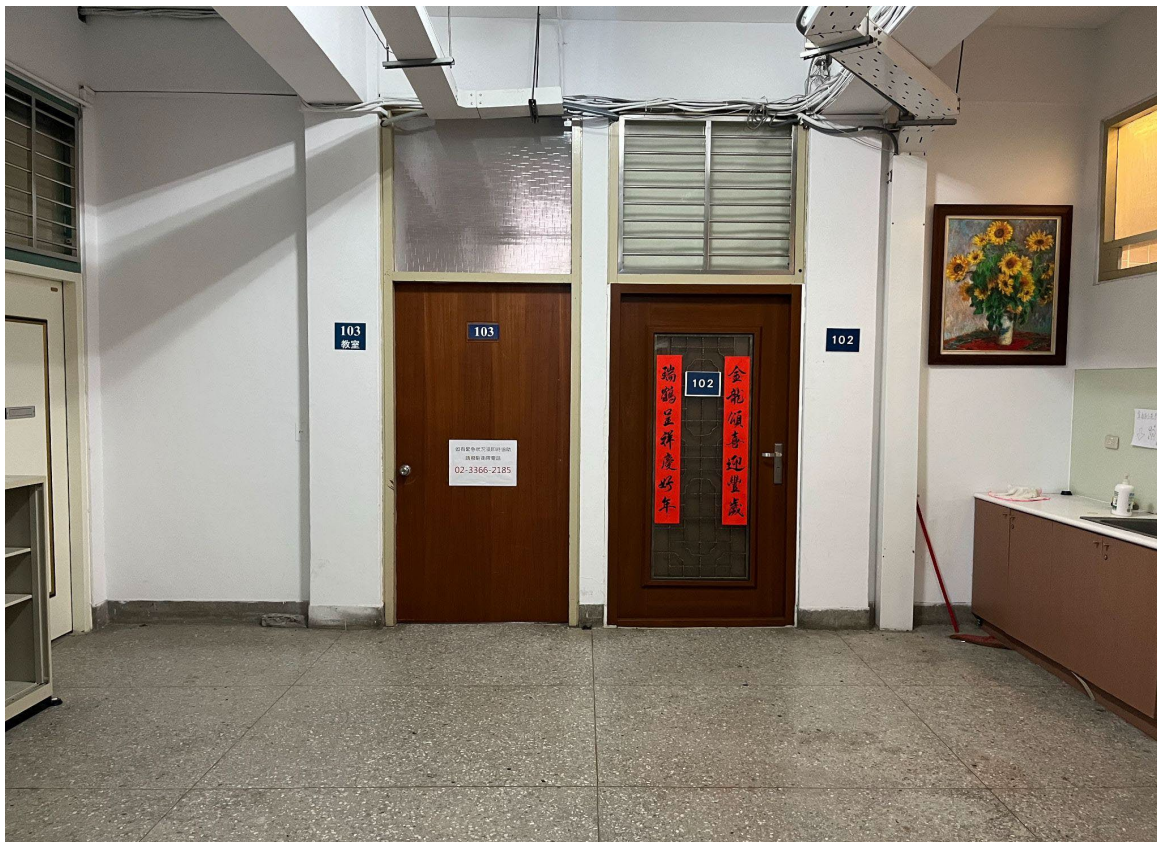
9.學輔中心臨時辦公室在 102 室